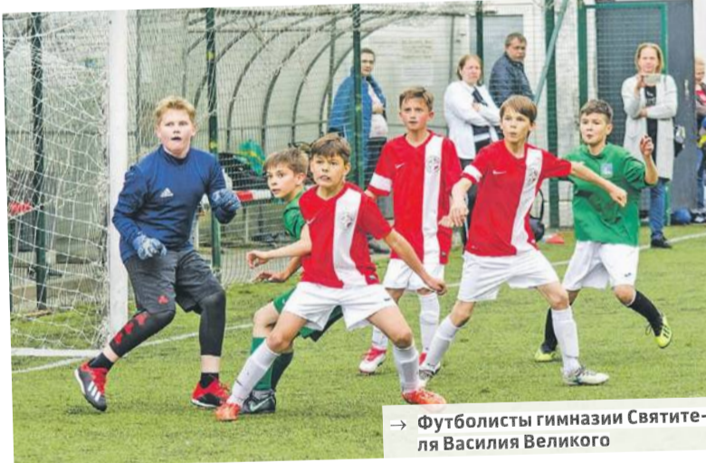
→ Футболисты гимназии Святителя Василия Великого

Дальше – больше. Как уже говорили, Гимназия Святителя Василия Великого и сама стала федеральной экспериментальной (инновационной) площадкой, т.е. полноправным участником процесса подготовки спортивного резерва. А весной этого года еще и победила в конкурсе Министерства спорта России на предоставление грантов из федерального бюджета в области физической культуры и спорта.