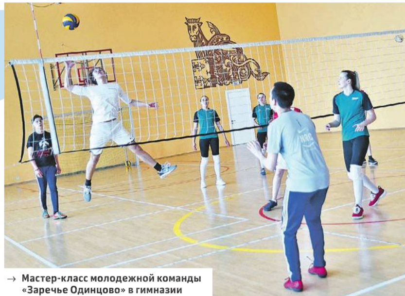
→ Мастер-класс молодежной команды «Заречье Одинцово» в гимназии

мают с я поэтапно, есть определенная надежда, что запланированный праздник волейбола для учащихся школ Одинцовского городского округа всё же состоится в той или иной форме. Во всяком случае, рабочая группа из специалистов гим-